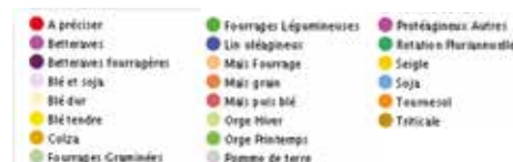
Le réseau d'expérimentation Chambres d'Agriculture - FDGEDA en Région Centre Val de Loire